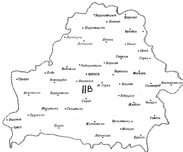
Рисунок А.4 - Схематическая карта климатического районирования территории Республики Беларусь для строительства